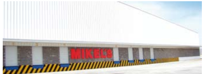
Centro de Almacenamiento Mikel's - CAM - / Mikel's Warehouse