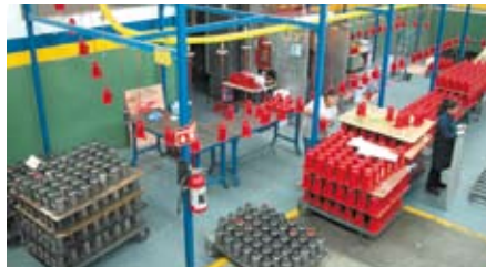
Línea de pintado y empaçado / Painting and packaging department