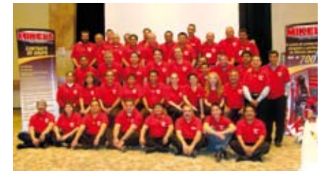
Equipo de ventas / Sales team