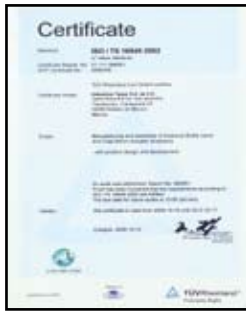
Certificado ISO-TS-16949 : 2009