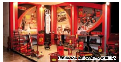
Exhibición de Producto MIKEL'S