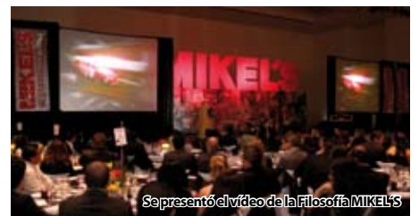
Se presentó el vídeo de la Filosofía MIKEL'S