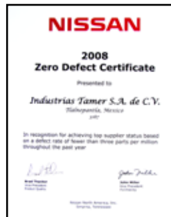
Premio de Cero Defectos