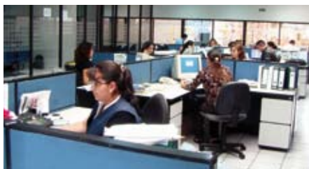
Oficinas de ventas / Sales Department