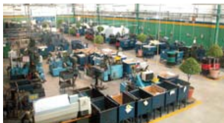
Layout estructurado en células de producción / Production cell layout