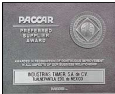
Certificado de Proveedor Preferente PACCAR