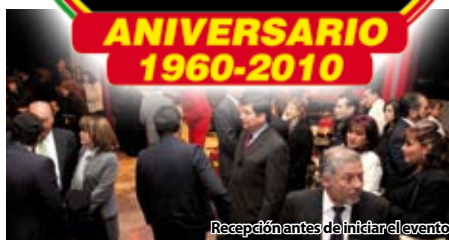
Recepción antes de iniciar el evento