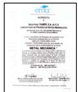
Laboratorio Certificado ante DGN

A nuestros clientes de equipo original. Gracias por su preferencia. / To our OEM customers, thank you for your preference.