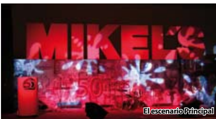
El escenario Principal