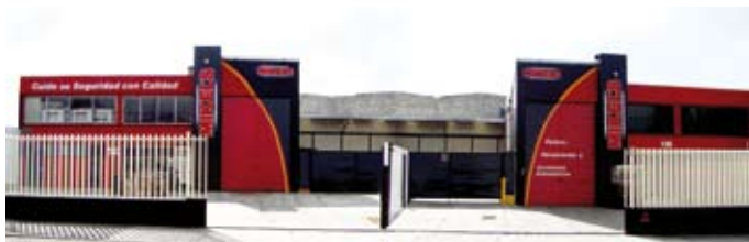
Oficinas de ventas / Sales Department