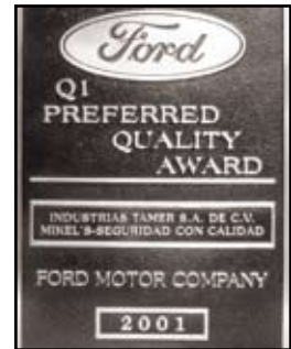
Q1 Premio Calidad Preferente