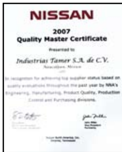
Premio de Calidad Maestra