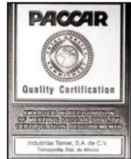
Certificado de Calidad Sobresaliente PACCAR