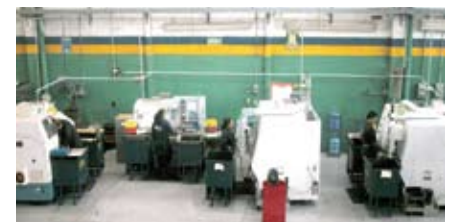
Maquinaria CNC / CNC Machinery