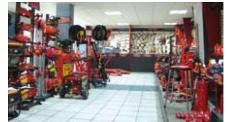
Show room permanente / Permanent show room