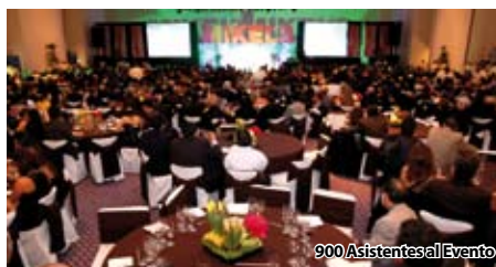
900 Asistentes al Evento