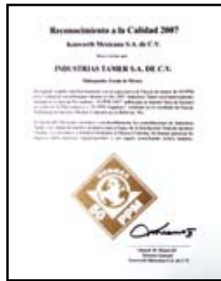
Reconocimiento a la Calidad