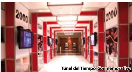
Túnel del Tiempo Conmemorativo