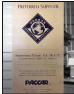
Certificado de Calidad Sobresaliente PACCAR