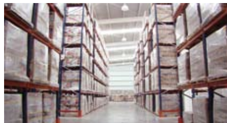
5 almacenes de producto terminado / 5 warehouses of finished goods