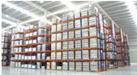
Centro de Almacenamiento Mikel's - CAM - / Mikel's Warehouse