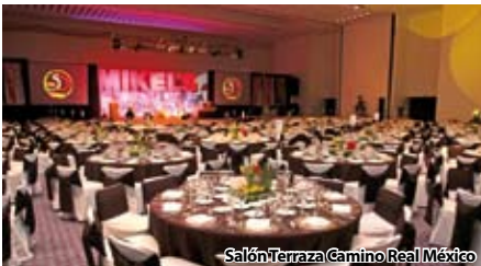
Salón Terraza Camino Real México