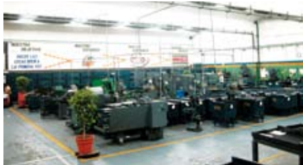
Instalaciones certificadas en ISO 14001 / Facility Certified in ISO 14001